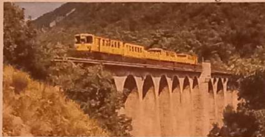
Le Petit Train Jaune (Le Canari)