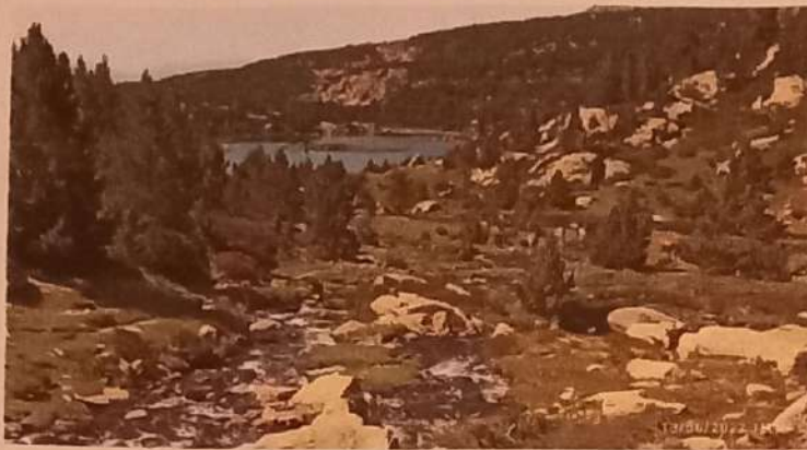
Lac et chevaux sauvages